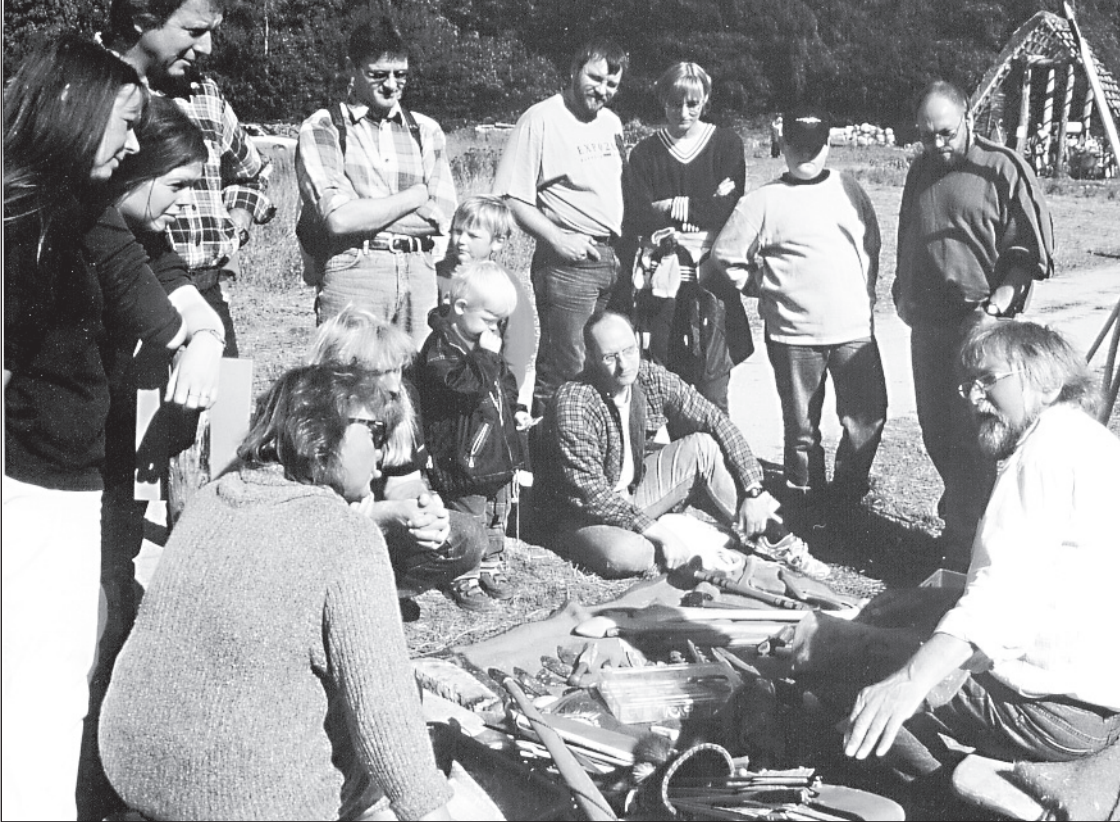
Fig. 7 Auf Aktionstagen finden diverse Vorführ- und Mitmachaktionen zu urgeschichtlichen Handwerkstechniken statt. ■