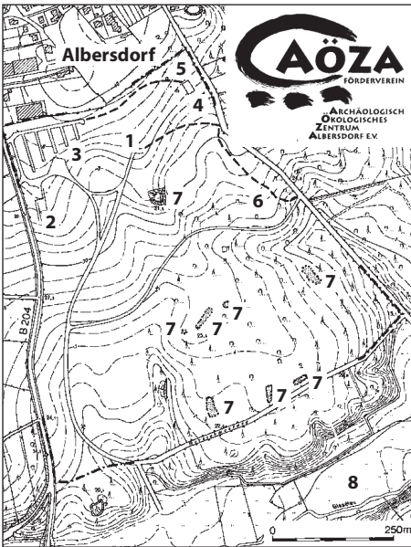
Fig. 1 Auf dem Gelände des Archäologisch-Ökologischen Zentrums Albersdorf befinden sich 8 archäologische Denkmäler in Form von Großsteingräbern und Grabhügeln. Die Karte zeigt ein mögliches Entwicklungskonzept der musealen Infrastruktur, das „Steinzeitdorf“ (Nr. 6) ist bereits errichtet. (1 Museum, 2 Cafeteria, 3 Besucherstellplätze, 4 Servicegebäude mit Werkstätte und Hausmeisterwohnung, 5 Stellplätze für mobiles Wohnen, 6 Steinzeitdorf, 7 Stein- und bronzezeitliche Grabstätte, 8 Naturschutzbereich Gieselautal) ■

erwähnt, ein polygonaler Großdolmen mit einem einzigen, riesigen Deckstein. Dieser Stein ist der größte seiner Art in Schleswig-Holstein, er hat einen Umfang von knapp 10 Metern und ein Gewicht von knapp 23 Tonnen. Das für die archäologische Forschung bedeutende Albersdorfer „Erdwerk“ liegt ca. 2 km weiter im Südwesten auf der Flur Dieksknöll. Es wurde erst 1992 bei gezielter Luftprospektion entdeckt (Arnold 1995). Weitere besonders hervorzuhebende Denkmäler im Albersdorfer Amtsbereich sind der älterbronzezeitliche Schalenstein von