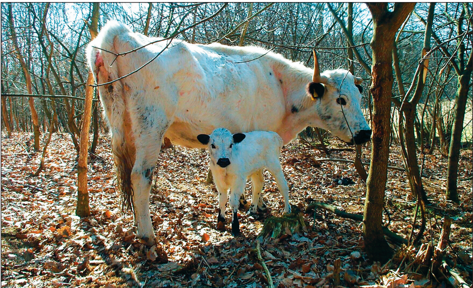
Fig. 2 Zum Konzept der Landschaftsentwicklung des AÖZA gehört auch eine extensive Beweidung mit für die Jungsteinzeit nachgewiesenen Nutztierassen wie Rindern, die in Form der robusten Englischen Parkrinder im Freigelände, darunter auch in Teilbereichen des Waldes, gehalten werden. ■