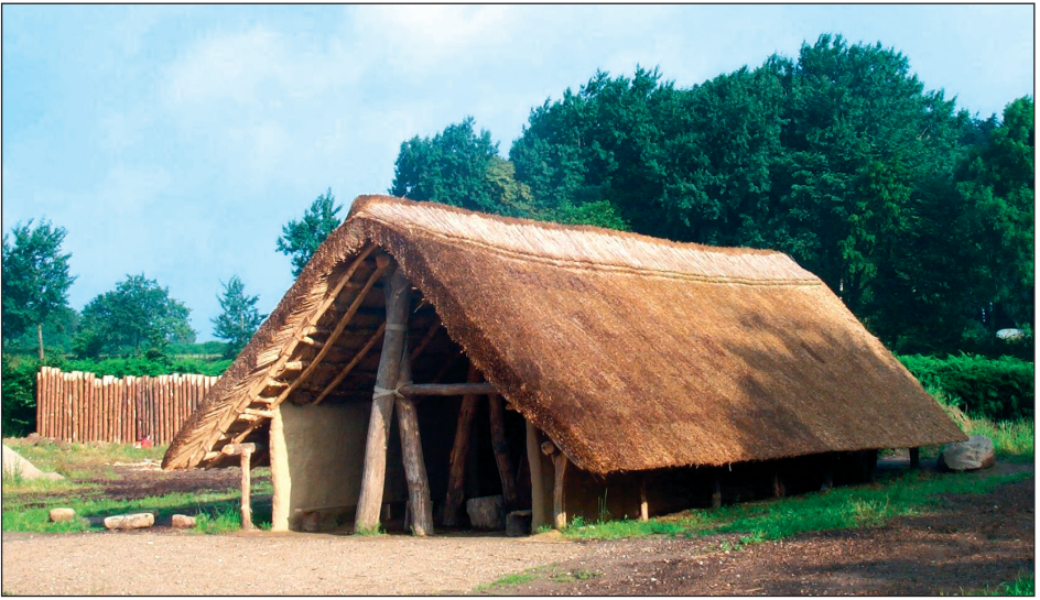
Fig. 3 Das als Modell im Maßstab 1:1 aufgebaute „Haus von Flögeln“ (nach Zimmermann 2000) steht neben zwei anderen Nachbauten im „Steinzeitdorf“. ■

und Nutzbarkeit den Eindruck einer Landschaft der Jungsteinzeit vermittelt (Kobbe 2004). Basis für diese Arbeiten sind wissenschaftliche Vorgaben, die u. a. in einer Fachtagung in Albersdorf zusammengetragen werden konnten (Kelm 2001) und die durch ein neues Forschungsprojekt des Ökologie-Zentrums der Universität Kiel zur bodenkundlichen Entwicklung (Reiss u. Bork 2005) sowie zur Vegetationsgeschichte (Dörfler 2005) der Dithmarscher Geest ergänzt werden. Gleichzeitig wird dabei ein attraktiver Erholungsraum geschaffen und die ökologische Situation im Projektgebiet verbessert. Die Arbeiten dazu haben im Sommer 1997 begonnen. Die landschaftliche Erschließung in Form von Wegebau, Durchforstung, Anpflanzung, extensiver Beweidung und Bereitstellung von Informationen ist dabei bereits weit vorangeschritten (Abb. 2).