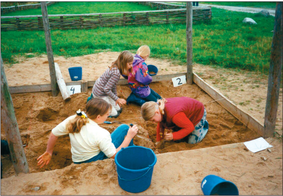
Fig. 6 Auf einer präparierten Fläche können Kindergruppen und Schulklassen die Prinzipien und Methoden einer archäologischen Ausgrabung erlernen. ■