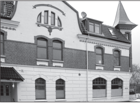
Fig. 4 Das neue Museum für Archäologie und Ökologie Dithmarschen befindet sich in unmittelbarer Nachbarschaft des Albersdorfer Bahnhofs. Ab Sommer 2005 dient es auch als Ausgangs- oder Endpunkt pädagogischer Programme im nur 800 m entfernten AÖZA-Gelände. ■

persönliche Vorabsprache zwischen dem Büro des Fördervereins AÖZA und dem Gast berücksichtigt.